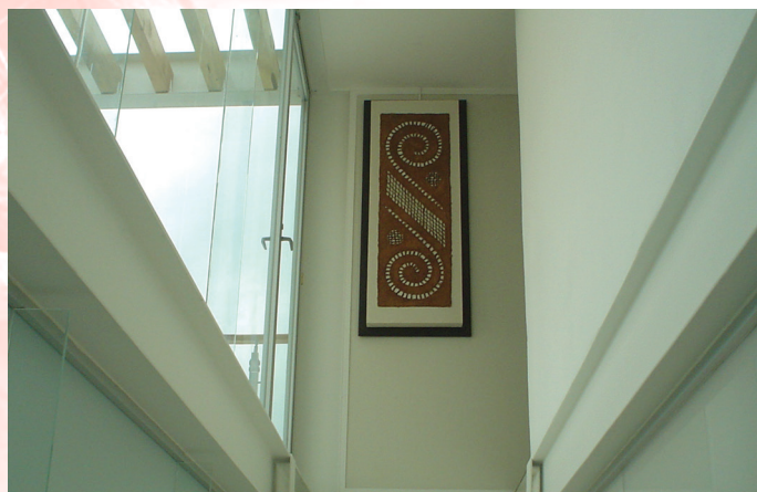
Proyecto arquitectónico Marvan Arquitectos. Arq. Ramón Moheno M.