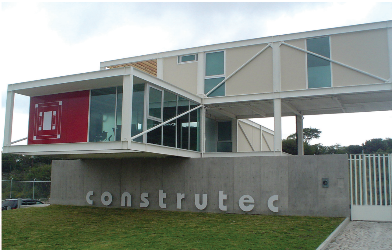
Proyecto arquitectónico Marvan Arquitectos. Arq. Ramón Moheno M.