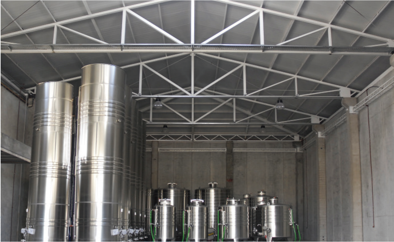
Cumple con la norma: NOM-008-ZOO-1994.